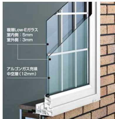
●アルゴンガス充填の複層 Low-E ガラス付樹脂サッシ