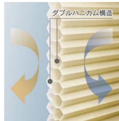
●断熱ハニカムシェード 熱逃げを抑え冷暖房費を節約！