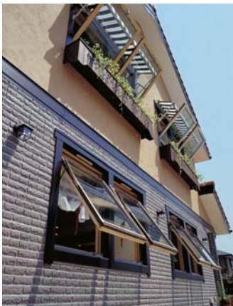
●省エネ建材等級の最高等級4スターを上回る木製サッシ3層ガラス窓を使用