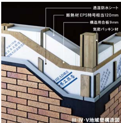
●超断熱性・超気密性を発揮する オリジナル「高性能パネル」