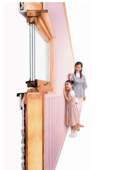
●壁にはたっぷりの断熱材を充填