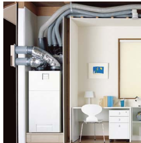
●世界最高水準の省エネ性能！ 熱交換換気システムを標準装備