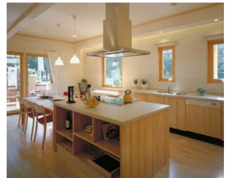
●北欧天然木をふんだんに使ったキッチン(IHクッキングヒーター)